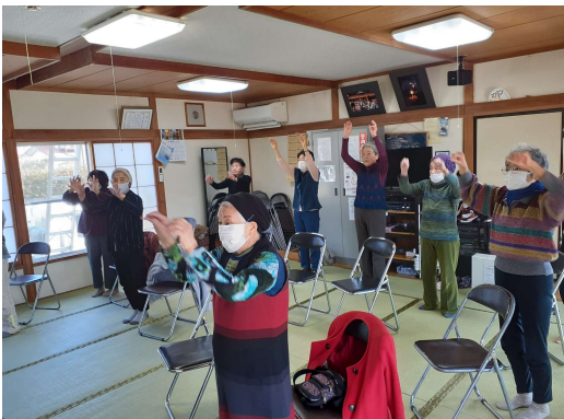
ほうらいももりん会