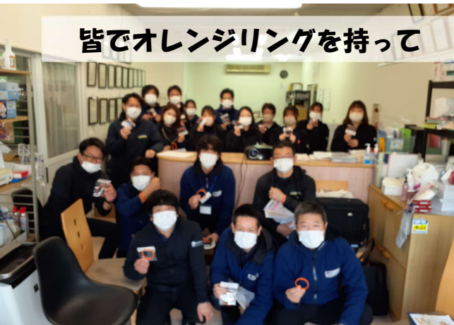
皆でオレンジリングを持って

R7年1月、エヌケイ商事さんに認知症サポーター養成講座を受講いただきました。車いすや介護ベッドなど、福祉用具を取り扱う事業所のエヌケイさん。今回は社長をはじめ社員の方たち全員に講座を受けていただき、皆さんとても熱心に講座を聞かれました。包括ではこれからも、認知症に優しい地域を目指して認知症の理解、普及啓発に取り組んでいきます。3月には蓬萊中学校の1年生へも、認知症サポーター養成講座を行う予定となっています!